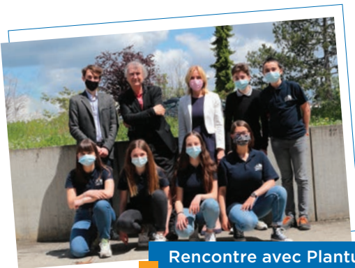
Rencontre avec Plantu

Les jeunes élus participent à différentes animations au sein de la ville de Taverny, dans l'organisation, l'accueil ou l'animation de celle-ci.