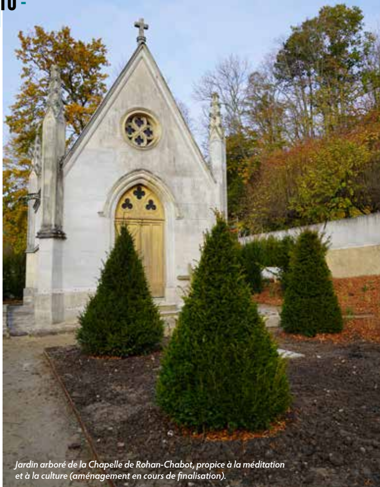
Jardin arboré de la Chapelle de Rohan-Chabot, propice à la méditation et à la culture (aménagement en cours de finalisation).

Un ensemble paysager d'envergure a été mis en place dans le cadre de cette requalification, également piloté par l'architecte des Monuments Historiques. De nombreux végétaux ont été plantés sur la partie située à l'avant de la chapelle : ifs, arbres et arbustes, (camélias, fusains, aubépines, viornes, seringats...). Des massifs de vivaces permettent de créer le cheminement naturel du promeneur. Sur la partie située à l'arrière du monument, du gazon et des arbres fruitiers (cerisiers, poiriers, arbres de Judée...) ont été plantés afin de retrouver le caractère historique du site avec la mise en place d'un verger. Enfin, des plantes grimpantes (jasmins, rosiers, clématites...) plantées le long des murs de clôture apporteront douceur et romantisme au site.