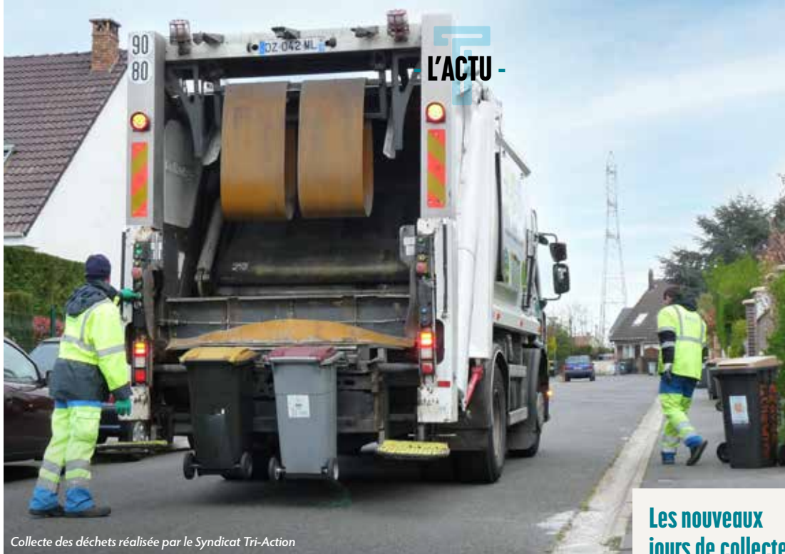
Collecte des déchets réalisée par le Syndicat Tri-Action