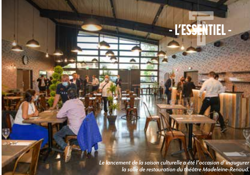
Le lancement de la saison culturelle a été l'occasion d'inaugurer la salle de restauration du théâtre Madeleine-Renaud.