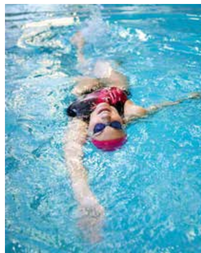
L'association Plongée Loisirs Taverny vous invite à faire des longueurs pour récolter des fonds

« À ne pas manquer : marche nocturne Téléthon, départ place Verdun, samedi 4 décembre à 16h30 »